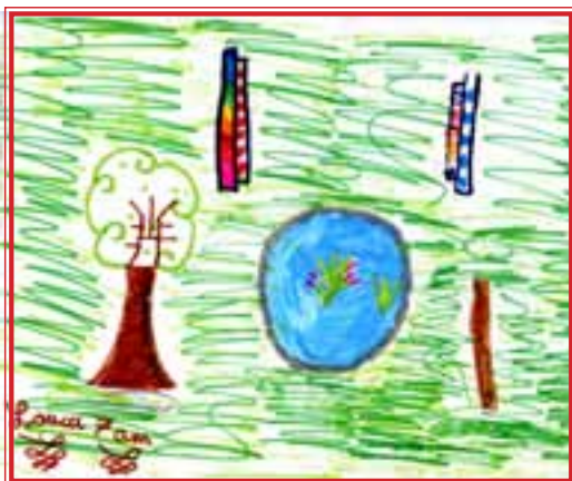
DESSIN DE LA MARE... PAR LOUCA

Les enfants ont été fiers de la présenter à leurs parents lors de la fête de fin d'année du périscolaire (Le festi' mare).